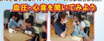
血圧・心音を聞いてみよう