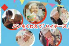
パンをくわえて「ハイヒール」