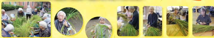
皆さん笑顔いっぱいでした！