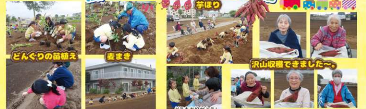
どんぐりの苗植え