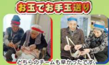
お玉でお手玉競争